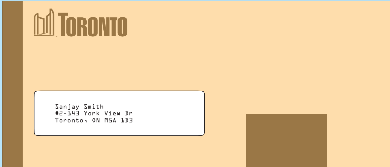
Sobre con ventana exterior. (Tamaño: n° 10)